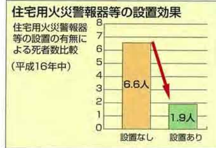
数値は「火災統計」のデータ(平成16年)による

日本の住宅火災においては、住宅用火災警報器等が設置されていた火災と、設置されていなかった火災を、住宅火災100件当たりの死者数で比較すると、設置されていた場合には約3分の1の死者数となっています。火災による被害から身を守るためにも、早期に設置するようにしましょう。