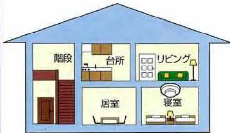
2階建てで1階に寝室・居室がある場合