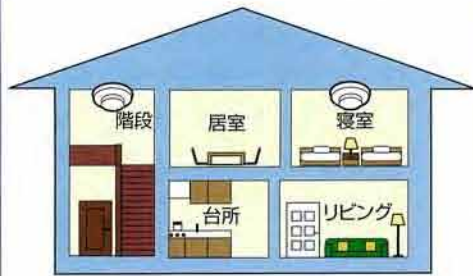
2階建てで2階に寝室・居室がある場合