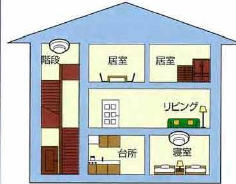
3階建てで1階に寝室、3階に居室がある場合