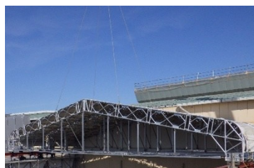
工場棟解体ヤード設置完了