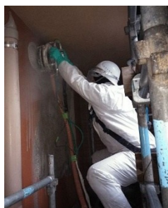
管理棟石綿除去状況