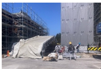
工場棟解体ヤード設置状況