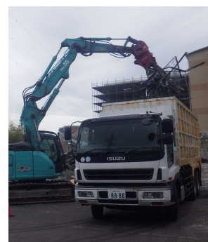
解体材積み込み状況